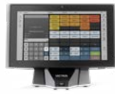
POS Touch 14 Wide