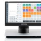
POS 7 Mini